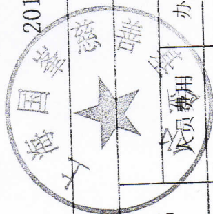
2019年走向西部公益项目捐赠支出表